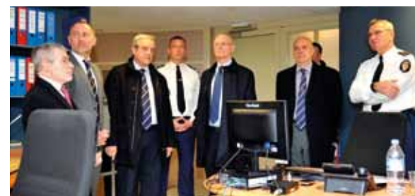
... Le Poste de Commandement et des Transmissions Operationnelles...