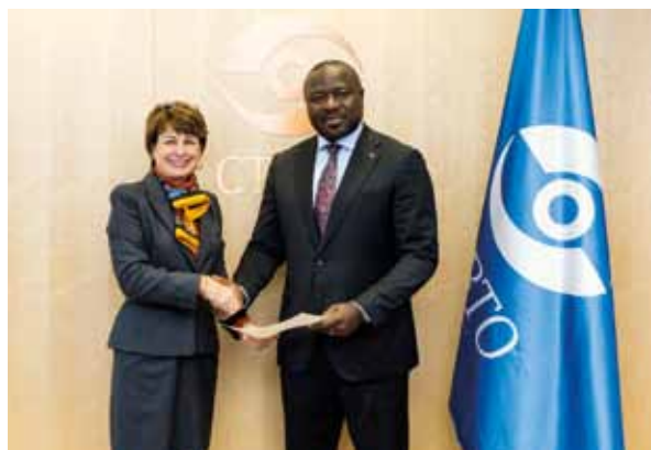
Lors de son entretien avec le Secrétaire Exécutif, Lassina ZERBO, l'Ambassadeur a rappelé que la Principauté finance depuis 2011 des activités de formation et de renforcement des capacités en faveur de ressortissants d'Etats du continent africain.

Les activités de cette Organisation concernent la détection et la collecte de données visant à permettre des vérifications dans certains domaines liés au nucléaire, mais également celles destinées à l'usage civil comme les données sismiques et hydroacoustiques.