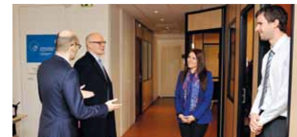
... L'Institut Monégasque de la Statistique et des Etudes Economiques...