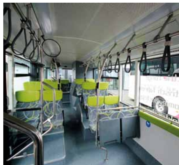
A l'intérieur, le vert est la couleur dominante, évoquant les qualités environnementales de ces nouveaux bus.

« Dérivés d'un modèle en circulation depuis 2014, ces véhicules sont en mesure de rouler en mode totalement électrique sur le faux plat et