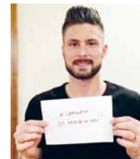
Lors de cette assemblée annuelle, le soutien du footballeur Olivier GIROUD, Ambassadeur du Monaco Collectif Humanitaire, a été rappelé, notamment son implication dans la campagne de crowdfunding #SaveNato organisée en décembre 2015 et relayée sur les réseaux sociaux.

Site du Monaco Collectif Humanitaire : www.mch.mc