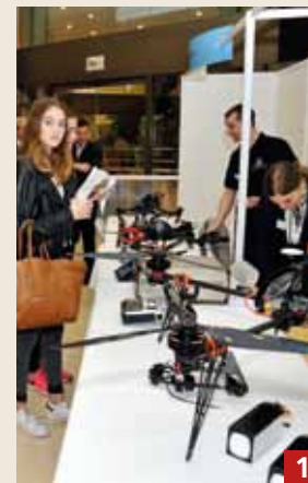
1 L'Agora des Métiers, anciennement « Journée des Métiers », représente un temps fort de l'orientation scolaire des collégiens des classes de 3 e de la Principauté. Elle a pour objectif de permettre aux élèves de mieux connaître les métiers de différents secteurs professionnels.

Le 2 février, la Direction de l'Education Nationale, de la Jeunesse et des Sports organisait « l'Agora des Métiers » et « l'Après-midi de Découverte Professionnelle » dans le cadre de la Journée d'Information « Pour une Meilleure Orientation de nos Jeunes ». Cette journée avait pour but la construction du projet d'études et du parcours professionnel des élèves de la Principauté. Collégiens et lycéens sont ainsi allés à la rencontre des professionnels. Retour en images sur cette journée.