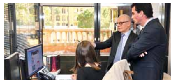
... La Direction de l'Administration Electronique et de l'Information aux Usagers...