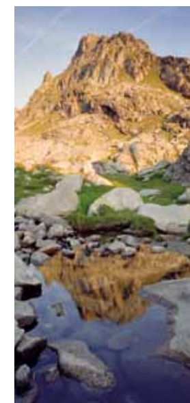
Afin que les visiteurs puissent accéder à la nature et à sa connaissance sans la détruire, le refuge de Bayasse, dans les Alpes de Haute-Provence, a été aménagé en espace d'information, d'échanges et de tourisme respectueux. D'autres structures seront prochainement ouvertes dans la Vallée des Merveilles, dont voici un cliché réalisé par Philippe RICHAUD.

près de 2 500 km 2 . Il a permis d'identifier quelque 12.000 espèces, dont certaines encore inconnues. A noter : la prorogation de la Convention cadre signée en juin prévoit la poursuite d'inventaires de certaines espèces.