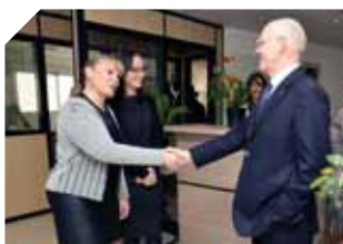
ME – Le Ministre d'Etat se rend dans les Directions et les Services

Afin de constituer les Commissions Paritaires de la Fonction Publique, les élections de leurs représentants se dérouleront du 18 au 21 avril. Tout fonctionnaire souhaitant se porter candidat pour intégrer cette instance de représentation et de dialogue est ainsi appelé à se déclarer auprès de la DRHFFP.