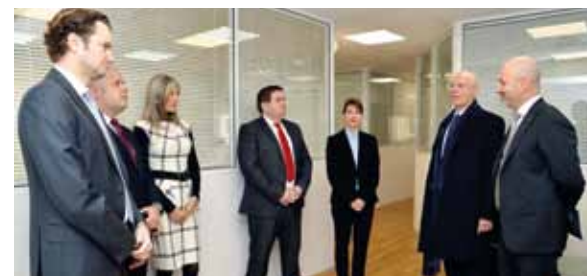
S.E. M. le Ministre d'Etat visite la Direction des Affaires Juridiques...

Dans le cadre de sa prise de fonction, S.E. M. le Ministre d'Etat a visité de nombreux Services et Directions de l'Administration. Ces visites lui ont permis d'établir un contact direct avec les fonctionnaires et agents de l'Etat. Retour en images.