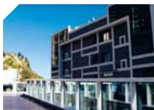
DASS – Ouverture du pôle consultations externes aux Tamaris