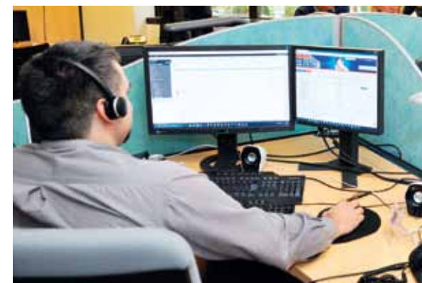
La disponibilité est l'une des priorités de ce Centre de Service. Ici, une demande est traitée en direct par l'opérateur.