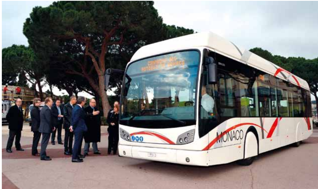
Parmi les innovations, des portes de type tramway, dont l'ouverture est commandée par le client, facilitant l'accès à bord et un affichage latéral de la destination améliorant la visibilité.

Soucieuse de renouveler régulièrement son parc afin d'offrir un service de qualité à ses clients, la Compagnie des Autobus de Monaco (CAM) va prochainement se doter de 7 nouveaux bus. Leurs particularités : un nouveau moteur plus écologique, une accessibilité accrue pour les personnes à mobilité réduite et un design modernisé.