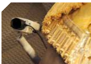
DFE – La télésurveillance dans les casinos