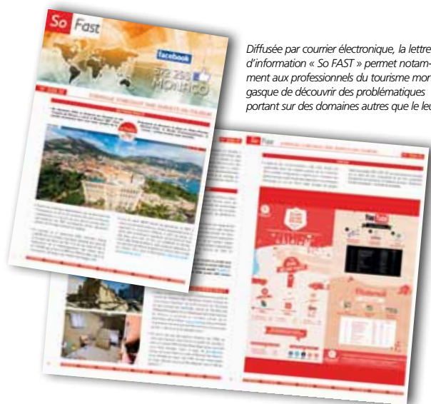
Diffusée par courrier électronique, la lettre d'information « So FAST » permet notamment aux professionnels du tourisme monégasque de découvrir des problématiques portant sur des domaines autres que le leur.

Pour vous abonner, il vous suffit d'en faire la demande à l'une des adresses suivantes : mmarquet@gouv.mc ou sponcet@gouv.mc.