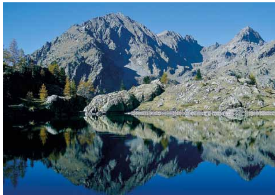
Grâce notamment au soutien de la Principauté et de la Fondation Prince Albert II, le Parc national du Mercantour pourrait bientôt faire partie d'un espace naturel inscrit au Patrimoine mondial de l'UNESCO. Ici, le très accueillant lac de Trécolpas.

« Le socle de ce projet, c'est l'originalité géologique du site, véritable témoin d'une époque ancienne. Des mouvements tectoniques complexes expliquent en effet sa grande diversité paysagère, mais aussi la multiplicité des espèces animales et végétales qu'il abrite et qui en fait l'un des 'points chauds' de biodiversité de la planète », précise