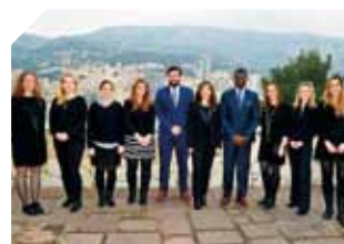
DREC – Présentation de la Direction des Affaires Internationales