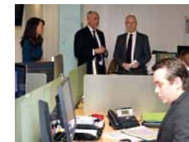
... Le Centre de Presse...