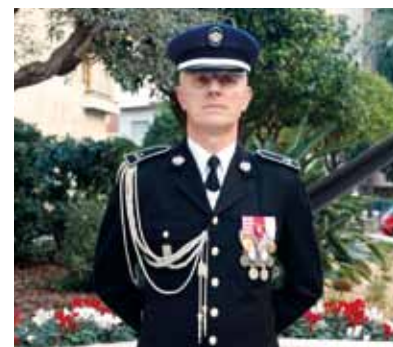
Gilles CONVERTINI est depuis le début de l'année le nouveau Commandant, par intérim, de la Compagnie des Carabiniers du Prince.

COMMANDANT PAR INTERIM DE LA COMPAGNIE DES CARABINIERS DU PRINCE