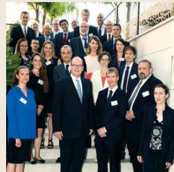
S.A.S. le Prince Souverain entouré des participants à la réunion d'experts internationaux sur « L'Antarctique et le Plan stratégique pour la biodiversité ».