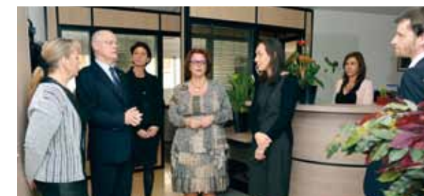
... La Direction des Ressources Humaines et de la Formation de la Fonction Publique...