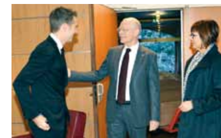
... Le Contrôle Général des Dépenses...