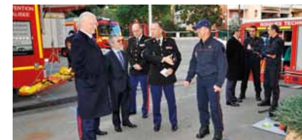
... La Caserne de Fontvieille, avec la Force Publique.

S.E. M. le Ministre d'Etat a par ailleurs également rendu visite au Centre National de Gestion de Crise et à l'ensemble des Départements.