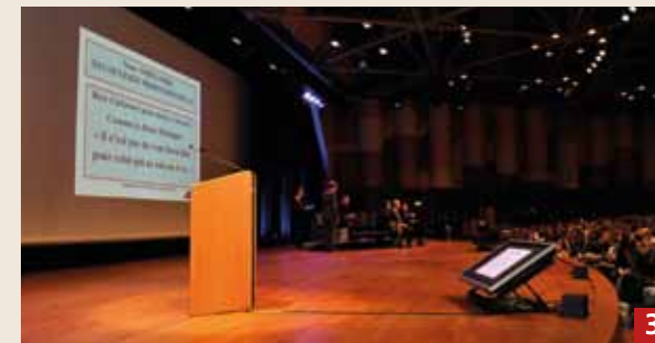
3 La 5 e Après-midi de Découverte Professionnelle, organisée par La Commission d'Insertion des Diplômés, en collaboration avec la Direction de l'Education Nationale, de la Jeunesse et des Sports, a permis aux élèves des classes de Terminale, BTS et DCG de s'informer sur les secteurs professionnels porteurs d'emplois en Principauté. L'objectif de cette session est d'aider les lycéens et étudiants à choisir, en étant pleinement informés, une future orientation en rapport avec des filières créatrices d'emplois à Monaco et à mieux identifier le lien entre le travail au lycée et le parcours de formation qu'ils pourront construire.