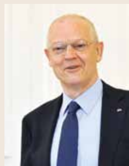
« Je crois beaucoup à l'esprit d'équipe, car c'est ensemble que nous pourrions relever les défis qui nous attendent. »

Ma volonté est de travailler dans la transparence et