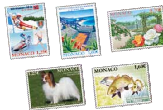
Conception : Andrew DAVIDSON

Organisé par la SMETT (Société Monégasque pour l'Exploitation du Tournoi de Tennis), le Monte-Carlo Rolex Masters est le 1 er tournoi européen de la prestigieuse catégorie des ATP World Tour Masters 1000. Les meilleurs joueurs du monde s'affrontent dans le cadre légendaire du Monte-Carlo Country Club du 9 au 17 avril.