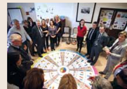
Les après-midis étaient dédiés aux cadres qui constituent ces nouvelles Directions. Des groupes de réflexion et d'autres ateliers ont permis d'identifier les avantages de la réorganisation mais aussi les perturbations qu'elle pouvait engendrer. Ces séminaires auront, sans nul doute, contribué significativement au développement d'une identité forte et d'un esprit d'équipe dans ces 2 nouveaux Services.