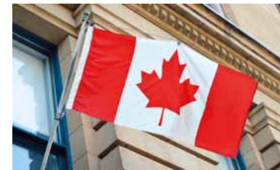
La validité de l'AVE sera pour un maximum de 5 ans et son coût est de 7 $ canadiens. A noter que les passeports des voyageurs devront avoir une durée de validité de 6 mois après leur retour.

Pour cela, les voyageurs devront au préalable remplir le formulaire de demande officiel se trouvant sur le site du Gouvernement canadien : www.cic.gc.ca/francais/visiter/ave.asp