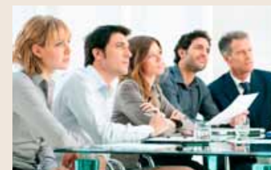
Les représentants de la Commission Paritaire compétente siègent aux conseils de discipline et aux jurys de concours. Dans certains cas, ils peuvent participer aux commissions médicales.

Les élections pour les Commissions Paritaires de la Fonction Publique se dérouleront du 18 au 21 avril prochain. Les fonctionnaires souhaitant faire acte de candidature doivent se déclarer, par écrit, auprès de la DRHFFP le 1 er avril au plus tard.